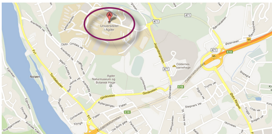
Kart fra Google Maps

Hvor finner du Universitetet i Agder? Gimlemoen 25, 4630 Kristiansand